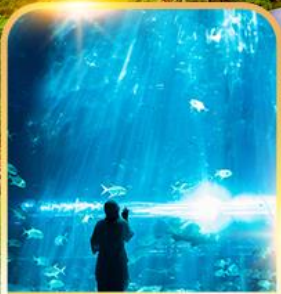
อควาเรียม