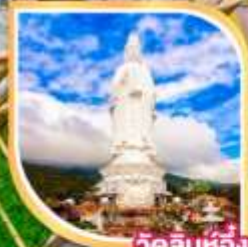
วัดลินห์ฮิ่ง