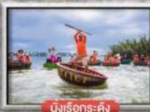
นั่งเรือกระดิง