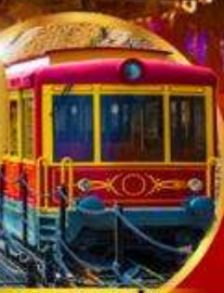
รถรางซาปา