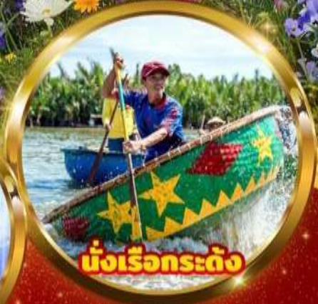
นั่งเรือกระด้ง