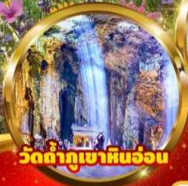
วัดถ้ำกู่เขาหินอ่อน