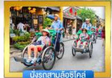
นั่งรถสามล้อซิโคล์