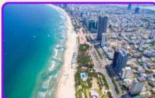
เช็คอิน ชายหาดหมีคว เป็นชายหาดที่สวยงามที่สุดในเมืองดานัง