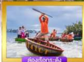
ล่องเรือกระดัง