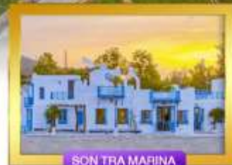
SON TRA MARINA