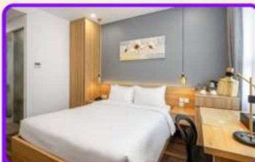
พักเมืองดานัง 4 ดาว 2 คืน