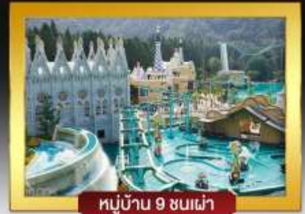
หมู่บ้าน 9 ชนเผ่า