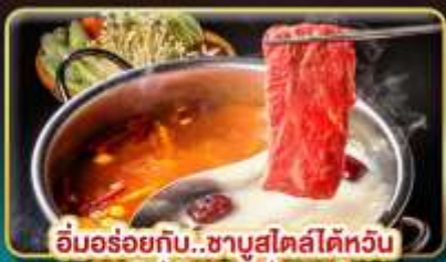
อิ่มอร่อยกับ..ชาบูสไตล์ไต้หวัน เมนูหม้อไฟจิ๋วพรีเมียม เสียวทงเป่า