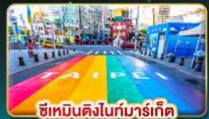
ซีเหมินติงไนท์มาร์เก็ต