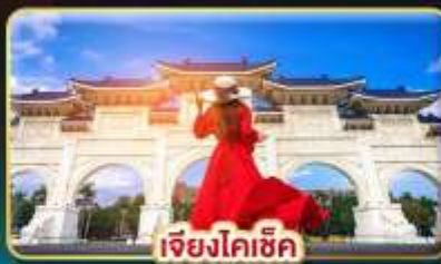
เจียงไคเช็ก