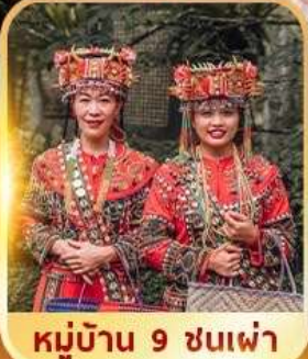
หมู่บ้าน 9 ชนเผ่า