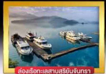
ส่องเรือทะเลสาบสุริยันจันทรา