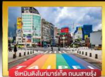
ซีเหมินติงไนท์มาร์เก็ต ถนนสายรุ้ง