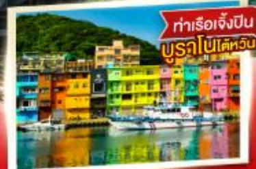
ทำเรือเจ็ปปิน บูราโนไปไต้หวัน