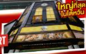
ใหญ่ที่สุด! ไปไต้หวัน