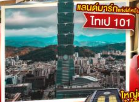
แลนด์มาร์กแห่งไต้หวัน ไทเป 101