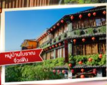
หมู่บ้านโบราณ จื่อกัฟิน