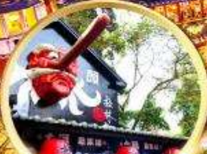
หมู่บ้านปิต่างชไต