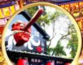
หมู่บ้านปิสางชิววี่