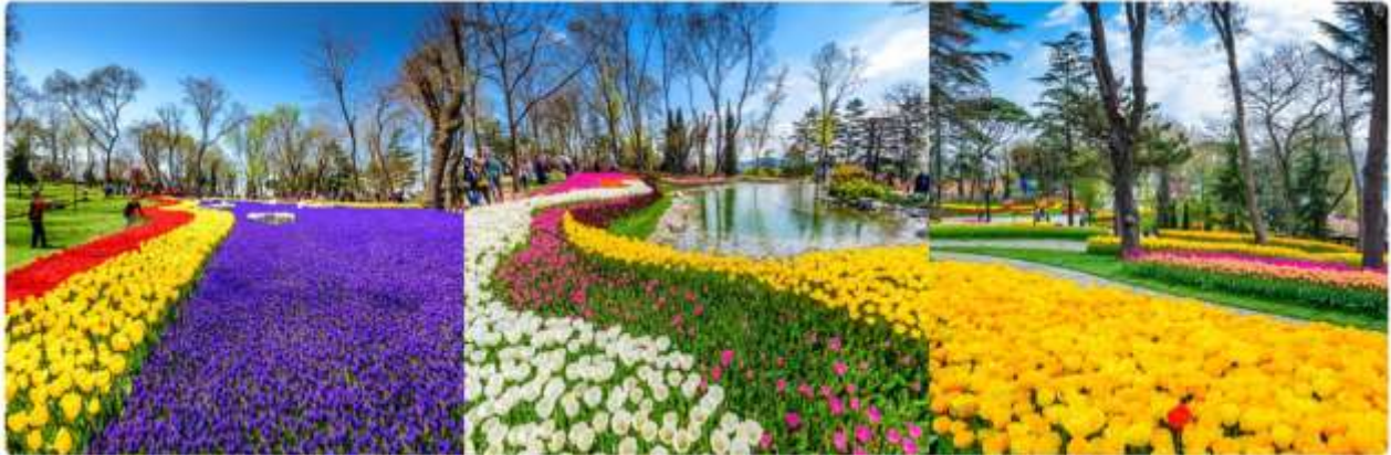
*ภาพเพื่อการโฆษณาเท่านั้น

เทศกาลทิวลิปอิสตันบูล เป็นเทศกาลประจำปี โดยจะจัดในช่วง 3 สัปดาห์สุดท้ายของเดือนเมษายน เพื่อเฉลิมฉลองทั้งฤดูใบไม้ผลิ และความสำคัญของดอกทิวลิป ที่มีต่ออาณาจักรออตโตมัน และวัฒนธรรมตุรกี ปกติแล้วเทศกาลนี้จัดขึ้นที่สวนสาธารณะ ที่มีชื่อเสียงที่สุดของเมือง ให้ทุกท่านได้ถ่ายรูปตามอัธยาศัย