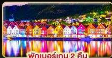
พักเบอร์เกน 2 คืน