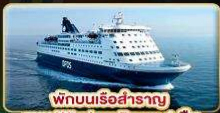
พักผ่อนเรือสำราญ แบบ Window Room 1 คืน