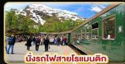
นั่งรถไฟสายโรเมนติก "ฟรอมสมาเนา"