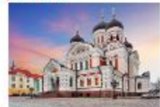
โบสถ์อเล็กซานเดอร์ เนฟสกี

19.35 น. ออกเดินทางสู่อิสตันบูล เที่ยวบิน TK1424