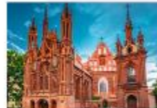
โบสถ์เซนต์แอน