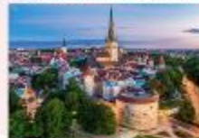
Tallinn Old Town