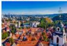
Vilnius Old Town