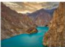
ทะเลสาบอิตตาบัต

** พักที่ Sarai Silk Route Hotel หรือเทียบเท่า **