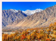
หุบเขาพาสสุ