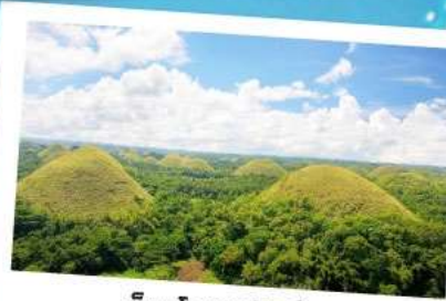
ช็อคโกแลตฮิลล์