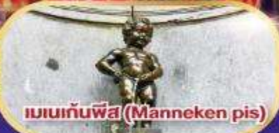
แมนเกนพิส (Manneken pis)