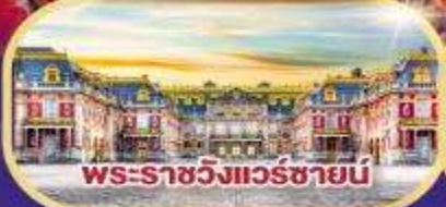
พระราชวังแวร์ซายน์