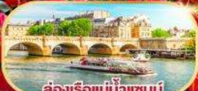
ล่องเรือแม่น้ำแซนน์