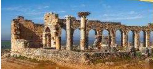
Roman City of Volubilis

เปิดประสบการณ์นอนนับดาวสุดฟิน กลางทะเลทรายซาฮารา "Luxury Camp"