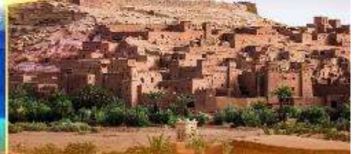
Kasbah of Ait Ben Haddou