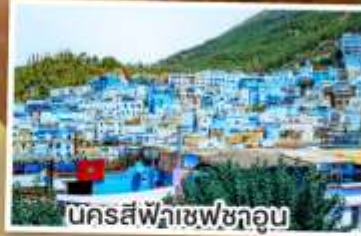
นครสีฟ้าเซฟซาอูน