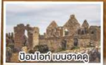
ป้อมโอ๊ก์ เบนฮาดดู