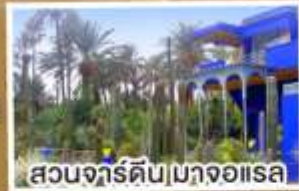
สวนจาร์ดิน|มาจอาเรล