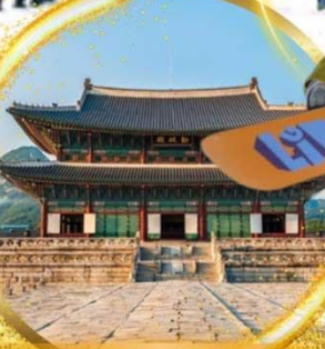
พระราชวังเคียงบกกุง