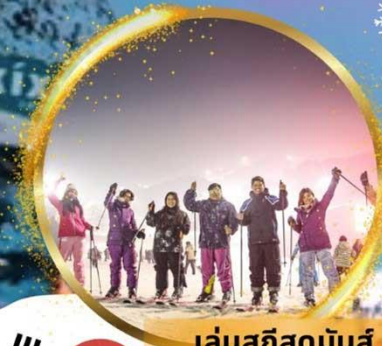
เล่นสกีสุดมันส์