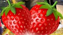
ชิมสตอเบอร์รี่สด ๆ จากไร่