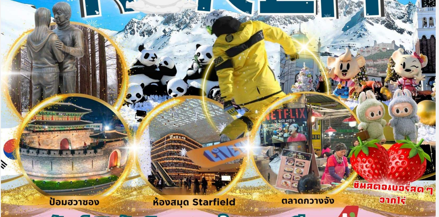
ป้อมชวาของ