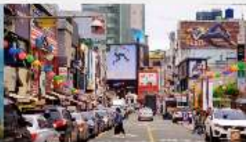
nampodong shopping street

*ทางบริษัทฯ ขอสงวนสิทธิ์ในการสลับโปรแกรมทัวร์ตามความเหมาะสมขึ้นอยู่กับสถานการณ์หน้างาน โดยคำนึงถึงผลประโยชน์ของลูกค้าเป็นสำคัญ