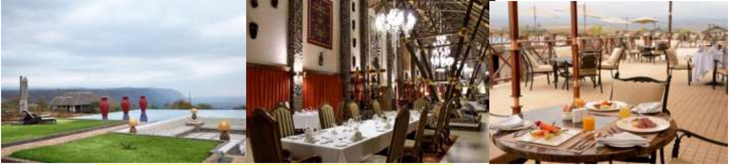
พักรับประทานอาหารค่ำ ณ ห้องอาหารของที่พักรับประทานอาหารค่ำ พักรับประทานอาหารค่ำ ณ ห้องอาหารของที่พักรับประทานอาหารค่ำ หรือเทียบเท่า (คืนที่1)