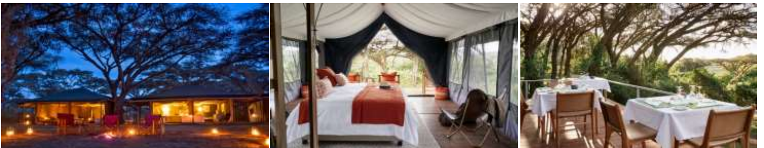
พักรับประทานอาหารค่ำ ณ ห้องอาหารของที่พักรับประทานอาหารค่ำ พักรับประทานอาหารค่ำ ณ ห้องอาหารของที่พักรับประทานอาหารค่ำ หรือเทียบเท่า (คืนที่2)