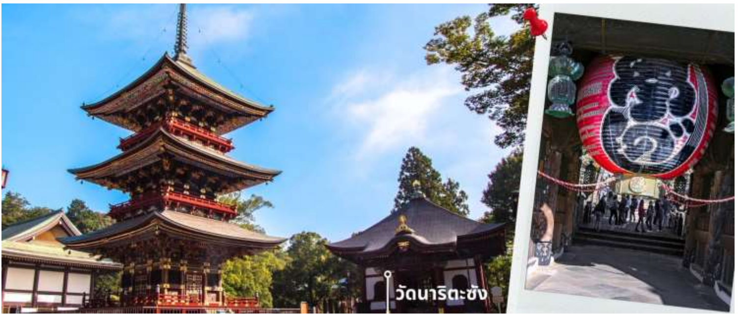
วัดนาริตะซัง

จากนั้นนำท่านเดินทางไปยัง AEON MALL ภายในตัวห้างมีร้านค้าต่างๆมากถึง 150 ร้านซึ่งตกแต่งในรูปแบบที่ทันสมัย สไตล์ญี่ปุ่นสินค้ามากมายหลากหลายให้เลือกตั้งแต่เสื้อผ้าแฟชั่นอาหารสดใหม่และอุปกรณ์ภายในบ้านรวมถึง เครื่องสำอางค์ขนมญี่ปุ่นต่างๆและยังมีร้านค้ามากมายไม่ว่าจะเป็น Muji, 100 yen shop, Sanrio store, Capcom games arcade และก็ยังมีซูเปอร์มาร์เก็ตขนาดใหญ่ให้ท่านได้เลือกซื้อของ