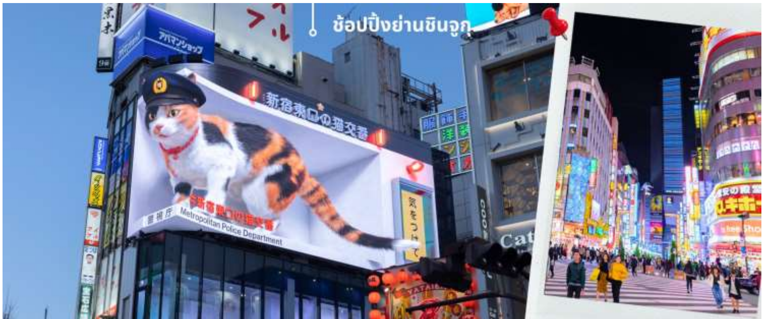
ช้อปปิ้งย่านชินจูกุ

พอสมควรแก่เวลา พาท่านเดินทางเข้าสู่ย่าน ซ้อปั้งชินจูกุ Shinjuku แหล่งช้อปปิ้งชื่อดังในโตเกียวให้ท่านอิสระและเพลิดเพลินกับการช้อปปิ้งสินค้ามากมายทั้งเครื่องใช้ไฟฟ้ากล้องถ่ายรูปดิจิตอลนาฬิกา เครื่องเล่นเกม หรือสินค้าที่จะเอาใจคุณผู้หญิงด้วยกระเป๋ารองเท้า เสื้อผ้าแบรนด์เนม เสื้อผ้าแฟชั่นสำหรับวัยรุ่น เครื่องสำอางยี่ห้อดังของญี่ปุ่นไม่ว่า