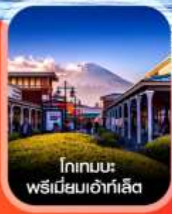
โกเทมบะ พรีเมียมเอาท์เล็ต