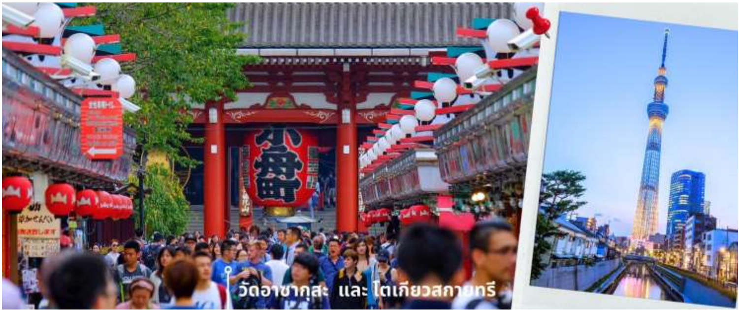
วัดอาซากุสะ และ โตเกียวสกายทรี

พอสมควรแก่เวลา พาท่านเดินทางเข้าสู่ย่าน ซ้อปั้งชินจูกุ Shinjuku แหล่งช้อปปิ้งชื่อดังในโตเกียวให้ท่านอิสระและเพลิดเพลินกับการช้อปปิ้งสินค้ามากมายทั้งเครื่องใช้ไฟฟ้ากล้องถ่ายรูปดิจิตอลนาฬิกา เครื่องเล่นเกม หรือสินค้าที่จะเอาใจคุณผู้หญิงด้วยกระเป๋ารองเท้า เสื้อผ้าแบรนด์เนม เสื้อผ้าแฟชั่นสำหรับวัยรุ่น เครื่องสำอางยี่ห้อดังของญี่ปุ่นไม่ว่า