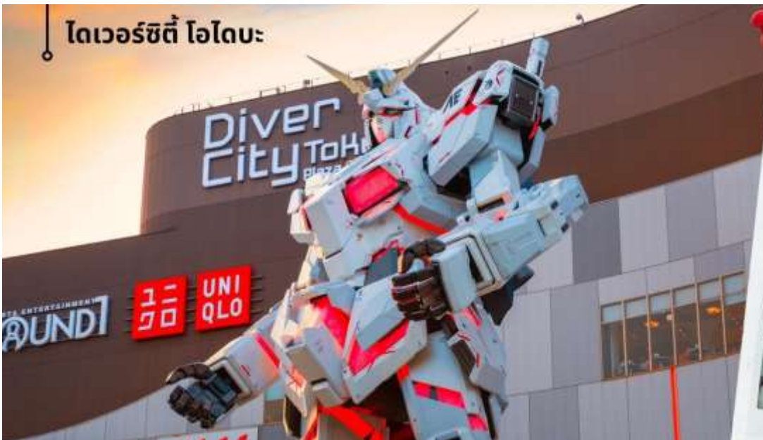
ไทเวอร์ซิตี โอไดบะ

จากนั้นนำท่านสู่ ไทเวอร์ซิตี โอไดบะ Diver City Plaza เป็นเกาะจำลองขนาดใหญ่ ซึ่งสร้างขึ้นจากการถมทะเลบริเวณอ่าวโตเกียว เดิมโตขึ้นอย่างรวดเร็วในฐานะเขตท่าเรือจนถึงช่วงทศวรรษที่ 1990 โอไดบะ ได้กลายเป็นย่านการค้ามี ห้างสรรพสินค้าขนาดใหญ่ที่ปักอาศัยและแหล่งบันเทิงที่ใหญ่โตแห่งหนึ่งให้ท่านได้ชม Unicorn Gundam หุ่นกันดั้มตัวใหม่เป็นรุ่น RX-0 Unicorn Gundam ในโหมด Destroy เป็น หุ่นสีขาว-แดงมีความสูงประมาณ 24 เมตร สูงกว่าหุ่นตัวเดิมถึง 6 เมตร และซอปปิงตามอัธยาศัย