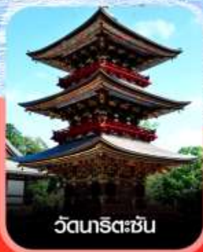
วัดเทริสึจิน