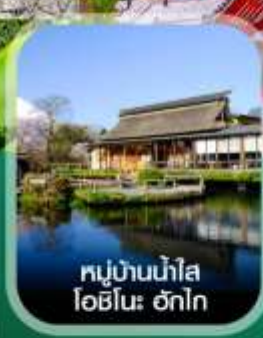
หมู่บ้านน้ำใส โอบิโนะ ฮักโก

คอนเฟิร์มออกเดินทาง ทุกพีเรียด 2 ท่านขึ้นไป