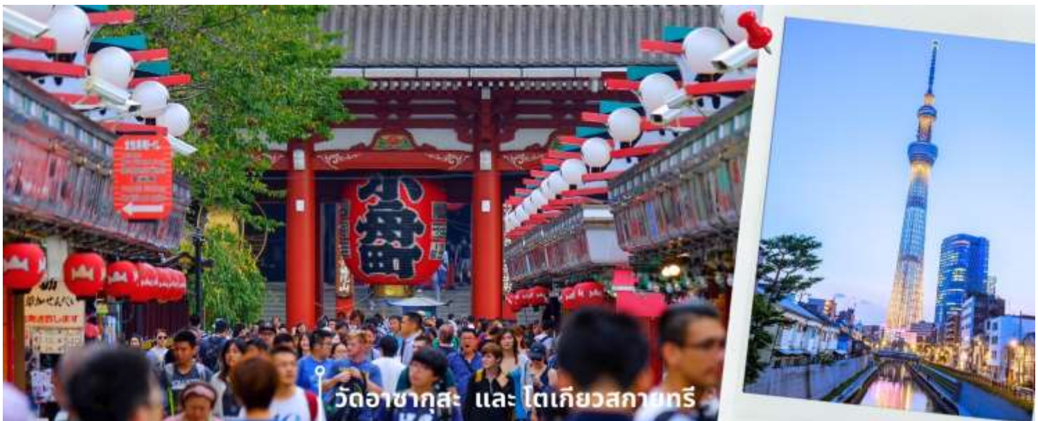
วัดอาซากุสะ และ โตเกียวสกายทรี

08.00 น. เดินทางถึงสนามบินนาริตะ ประเทศญี่ปุ่น หลังจากผ่านพิธีตรวจคนเข้าเมืองและศุลกากรแล้ว นำท่านขึ้นรถโค้ชปรับอากาศ จากนั้นเดินทางสู่ เมืองโตเกียว พาท่านสักการะ ที่ วัดอาซากุสะ (Asakusa Temple) วัดที่ได้ชื่อว่าเป็นวัดที่มีความศักดิ์สิทธิ์และได้รับความเคารพนับถือมากที่สุดแห่งหนึ่งในกรุงโตเกียวภายในประดิษฐานองค์