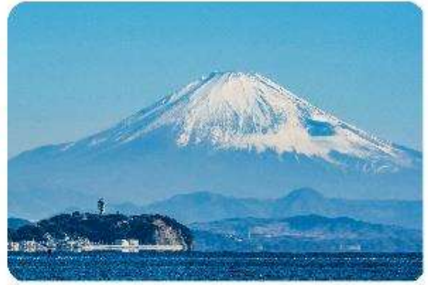
เกาะเอโนะชิมะ

เมืองคามาคุระ (Kamakura) เมืองน่ารักติดทะเล ตอบโจทย์ที่เที่ยวที่ผสมผสานระหว่างประวัติศาสตร์ ธรรมชาติ และความงามของทะเล บอกเลยใครมาต้องตกหลุมรักกับเมืองสุดชิล อย่าง คามาคุระ เมืองเล็กๆ ที่ตั้งอยู่ทางตอนใต้ของจังหวัดคานากาวะ ห่างจากโตเกียวเพียงแค่ 1 ชั่วโมง เท่านั้น แต่เต็มไปด้วยสถานที่ท่องเที่ยว ทิวทัศน์ธรรมชาติ และชายหาดที่งดงาม ที่นี้จะทำให้ทุกคนรู้สึกเหมือนได้ย้อนกลับไปสัมผัสประวัติศาสตร์ญี่ปุ่นในยุคซามูไร พร้อมทั้งได้ผ่อนคลายท่ามกลางบรรยากาศที่เงียบสงบและสดชื่น