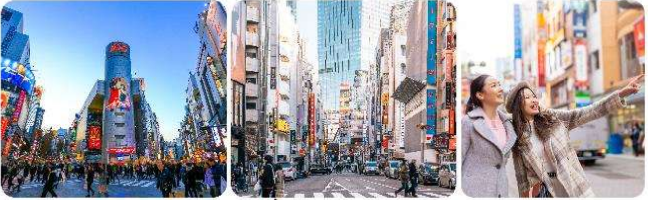
ช้อปปิ้งใจกลางกรุงโตเกียว