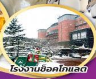
โรงงานช็อคโกแลต