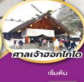
ศาลเจ้าออกโทโด