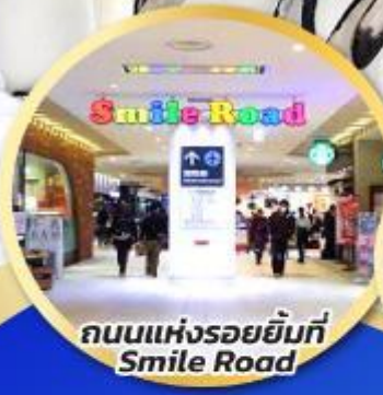
ถนนแห่งรอยยิ้มที่ Smile Road