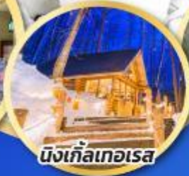
นิงเกิ้ลเทอเรส