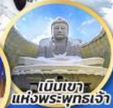
เป็นเขา แห่งพระพุทธรเจ้า

ชมความน่ารักของสัตว์ต่างๆ ที่พิพิธภัณฑ์สัตว์น้ำโอตารุ