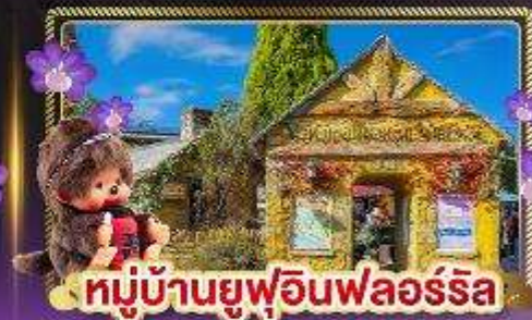
หมู่บ้านยูฟูอินฟลอร์ริล