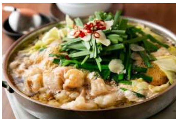
มตสึนาเบะ (Motsunabe)