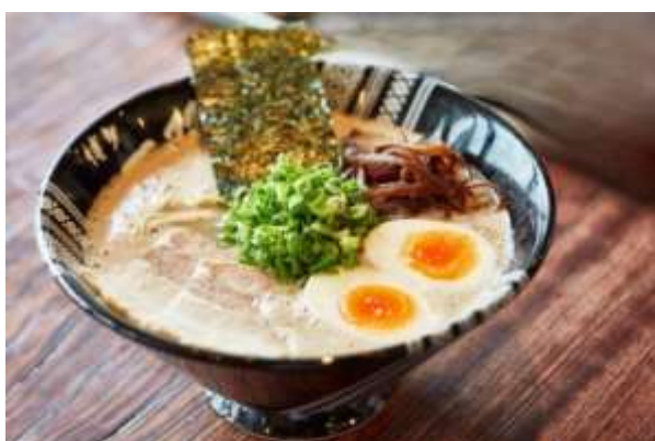
ฮากาตะราเมง (Hakata Ramen)