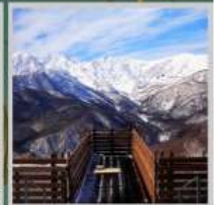
"HAKUBA MOUNTAIN HARBOR"