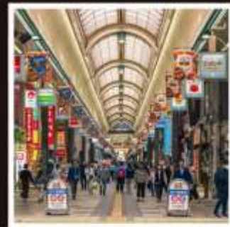
ถนนช้อปปิ้งทานุกิโคจิ

กระเช้าภูเขาฮาโกดาเตะ ชมวิวที่สวยงามที่สุด 1 ใน 3 ของญี่ปุ่น ระดับมิชลิน 3 ดาว Unseen Hokkaido ผลงานสถาปัตยกรรมชิ้นเอก ผสานธรรมชาติอย่างลงตัว “Hill of Buddha” หุบเขานรก จิโคะคุดาบิ สัมผัสบรรยากาศของแหล่งกำเนิดออนเซ็นชื่อดังที่สุดแห่งฮอกไกโด ขึ้นตากับภูเขาไฟอูสุ วิวทิวทัศน์อันงดงามและธรรมชาติสุดยิ่งใหญ่ ที่พลาดไม่ได้ ชมฟาร์มโคนมชื่อดัง มิเซโคะ ทาคาฮาชิ กับวิวโยเทสแนพิเศษ ช้อปปิ้งอย่างเต็มอิ่มจุกใจบนถนนทานุกิโคจิและมิตซึยะ เอาท์เล็ต พักออนเซ็น 2 คับ!!! ริมทะเล 1 คับ ริมทะเลสาบ 1 คับ อาหารพิเศษ...บุฟเฟ่ต์ซาบู, บุฟเฟ่ต์ซาบู กรุ๊ปสบายๆ เพียง 20 และ 30 ท่านเท่านั้น!!!