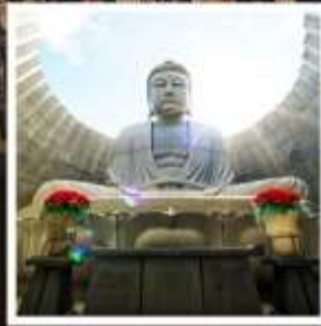
เนินพระพุทธรเจ้า