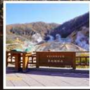
หุบเขานรกจิโคะคุดาบิ