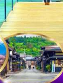
ทาคายาม่า