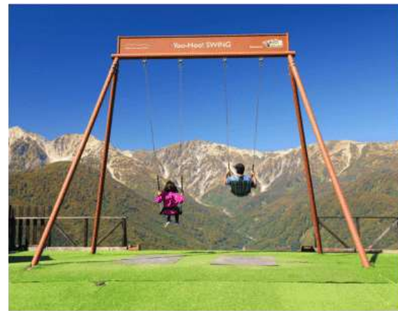
รูปใช้เพื่อประกอบการโฆษณาเท่านั้น

ห้ามพลาดกับการชมวิวแบบพาโนรามา ณ จุดชมวิเทือกเขาแอลป์แบบ 360 องศา (Hakuba Mountain Harbor) ด้วยทัศนียภาพที่เหนือชั้นของภูเขาโดยรอบ จุดเด่น คือ ระเบียง "Hakuba Sanzan" ที่สามารถเห็นเทือกเขาแอลป์แบบ 360 องศา ได้อย่างสวยงามในทุกฤดูกาล อีกทั้งสามารถยืนถ่ายรูป และดื่มด่ำกับบรรยากาศได้อย่างเต็มอัม ใน