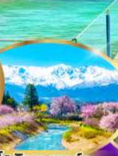
โอฮิเดะ พาร์ค