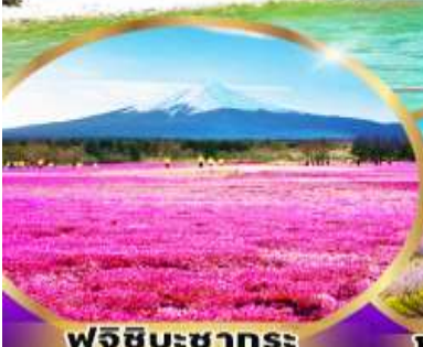
ฟูจิซึบะซากุระ