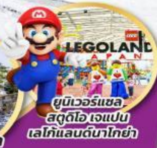
ยูนิเวอร์แซล สตูดิโอ เจแปน เลโก้แลนด์นาโกย่า