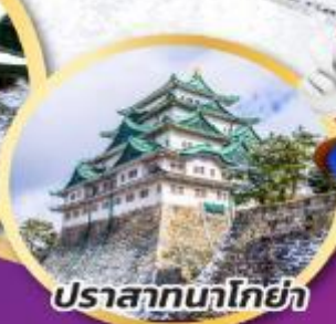
ปราสาทนาโกย่า