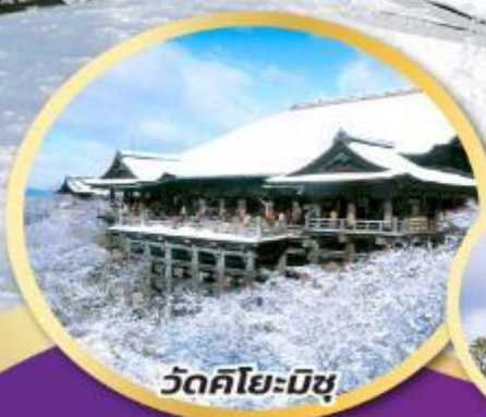
วัดคิโยะมิซึ