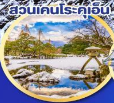
สวนเคนโรคุเอ็น