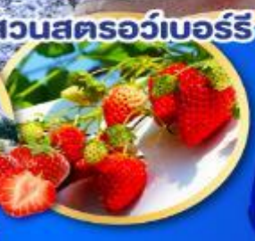
สวนสตรอว์เบอร์รี