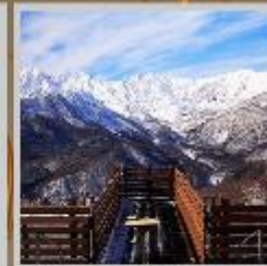
"HAKUBA MOUNTAIN HARBOR"

**ราคาทัวร์ดังกล่าวรวมค่าธรรมเนียมทริปแล้ว