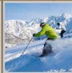
"HAKUBA SKI RESORT"