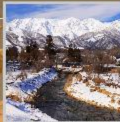
"HAKUBA OIDE PARK"