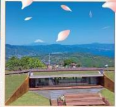
มิซูระ คาเฟ่321