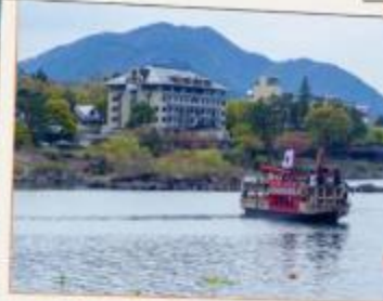
ล่องเรืออาปาเระ