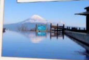
อิซุ พาโนราม่า พาร์ค