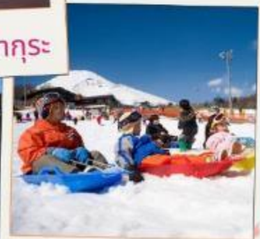
ลานสกีเยติ