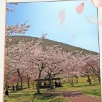
ซากุระ โนะ ซาโตะ