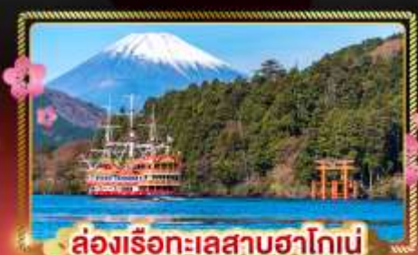
ล่องเรือทะเลสาบฮาโกเน่