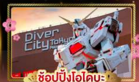
ช้อปปิ้งโอโดบะ