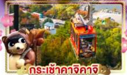
กระเช้าคางิจิกาจิ