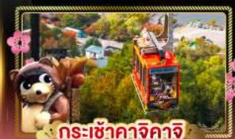
กระเช้าคางิจาคิจิ