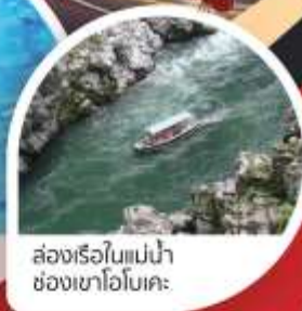
ล่องเรือใบแม่น้ำช่องเขาโอบิเคะ

Wifi on bus บริการน้ำดื่ม 10 คน ออกเดินทาง