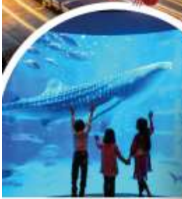
พิพิธภัณฑ์สัตว์น้ำโคคุยกัง