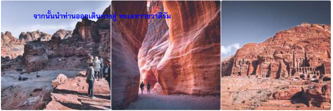
จากนั้นนำท่านออกเดินทางสู่ ทะเลทรายวาดีรัม

ค่ำ รับประทานอาหารค่ำ ณ แคมป์ที่พัก ที่พัก LUXURY RUM MAGIC CAMP (BUBBLE TENT) หรือเทียบเท่า