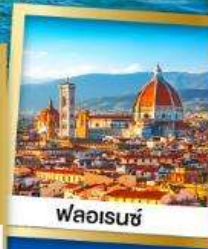
ฟลอเรนซ์