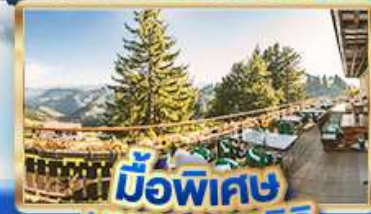
มือพิเศษ บียอดเวริท