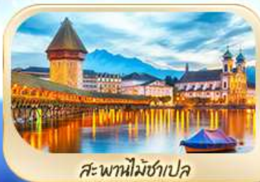
สะพานไมซ์ฮาเปล