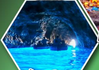
ถ้ำลูกรोटโต้