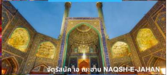
จัตุรัสบิก ๑๖ พระฮาน NAQSH-E-JAHAN