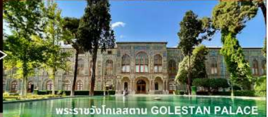
พระราชวังไกลสถาน GOLESTAN PALACE