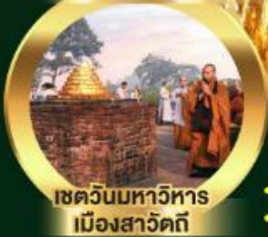
เขตวันมหาวิหาร เมืองสาวัตถี