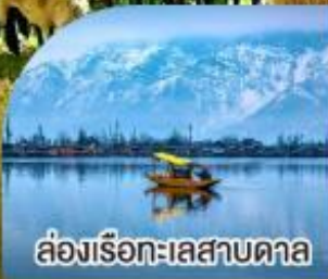
ล่องเรือทะเลสาบคาล